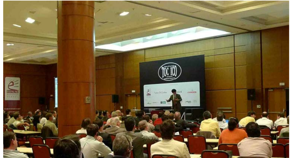
ブラジルのコンファレンスでの基調講演