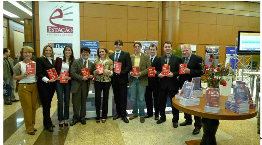
「和の経営改革」がブラジルで出版