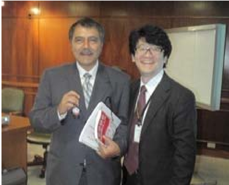
Mr. Andres Uriel Gallego 国土交通省大臣 Minister of infrastructure